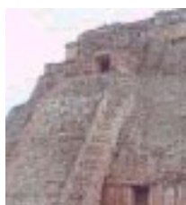
Templo Uxmal -México-

http://www.eso.org/outreach/press-rel/pr-2001/pr-02-01.html