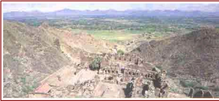
Ruinas Takht-i-Bahi - Templos budistas